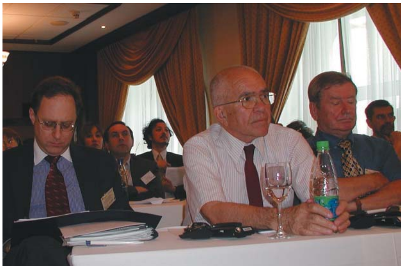
А. Вершбоу (Чрезвычайный и Полномочный Посол США в России с 2001 по 2005 г.), Р.М. Тимербаев, А.И. Зобов. Конференция «Перспективы российско-американского диалога по ядерному и ракетному нераспространению: вопрос Ирана» совместно с Центром стратегических и международных исследований (CSIS), 11 июля 2002 г.