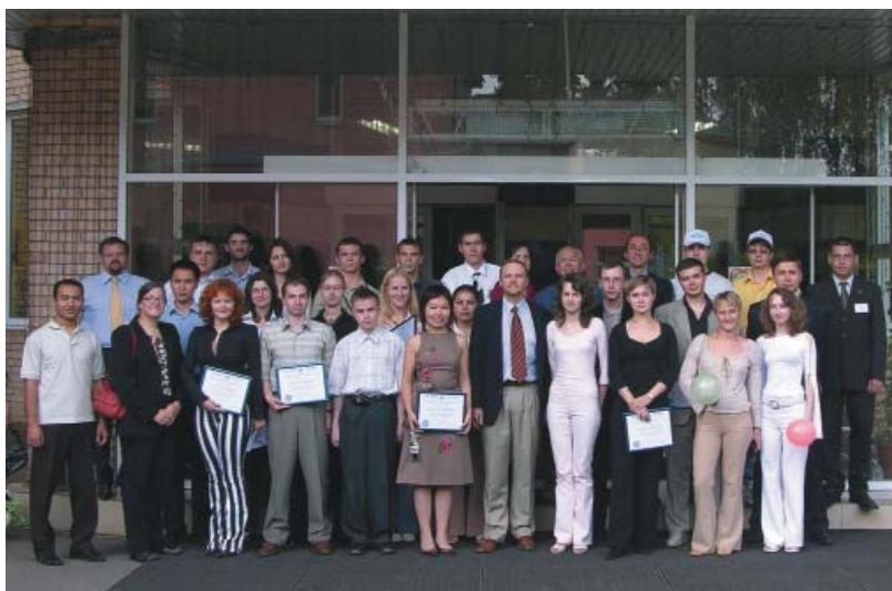
Международная школа ПИР-Центра по проблемам глобальной безопасности, лето 2005 г., с. Покровское, Московская область.