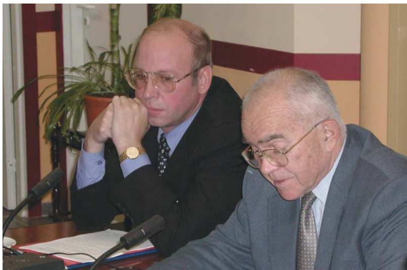
Экспертный семинар «Экспортный контроль в России: эволюция и перспективы», ПИР-Центр (совместно с Консорциумом «Партнерство во имя мира»), 24 октября 2002 г.