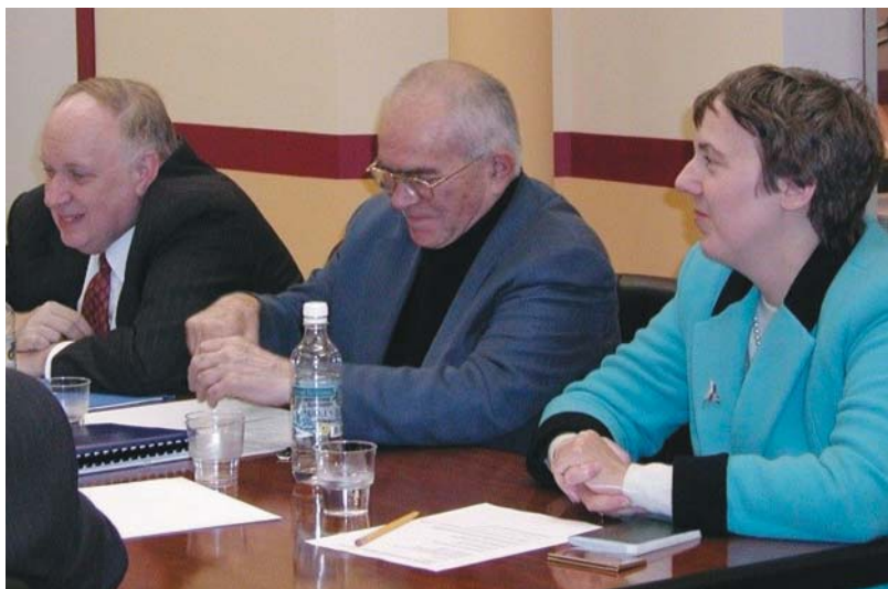
Посол Л. Брукс (заместитель министра энергетики США по ядерной безопасности с 2002 по 2007 г., первый слева), Р.М. Тимербаев (в центре). Встреча с Л. Бруксом, ПИР-Центр, 27 ноября 2001 г.