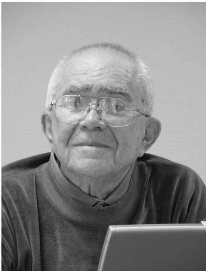
Чрезвычайный и Полномочный Посол СССР и России Р.М. Тимербаев (1927–2019)