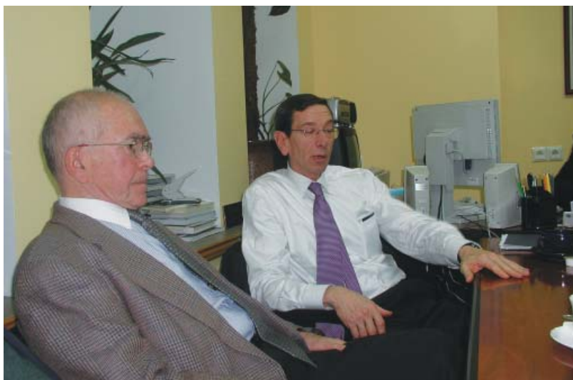
Встреча с бывшим заместителем госсекретаря по вопросам нераспространения ОМУ (1999–2001) США, членом Экспертного совета ПИР-Центра Р. Айнхорном, 3 ноября 2005 г.