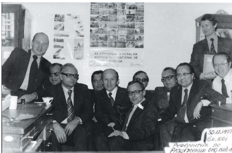
«Разоруженцы» в кабинете 1001 в здании МИД СССР на десятом этаже, где обсуждался проект ДНЯО и задумывались другие договоры и соглашения в сфере ядерного нераспространения и контроля над вооружениями.