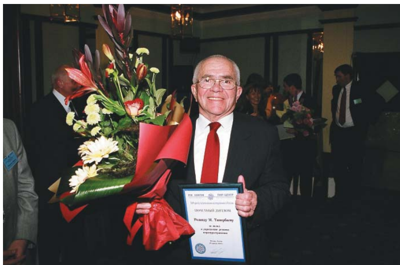
После вручения награды ПИР-Центра «За вклад в укрепление режима нераспространения». Конференция «Глобальное партнерство стран «Большой восьмерки» против распространения оружия и материалов массового уничтожения», 10 апреля 2004 г.